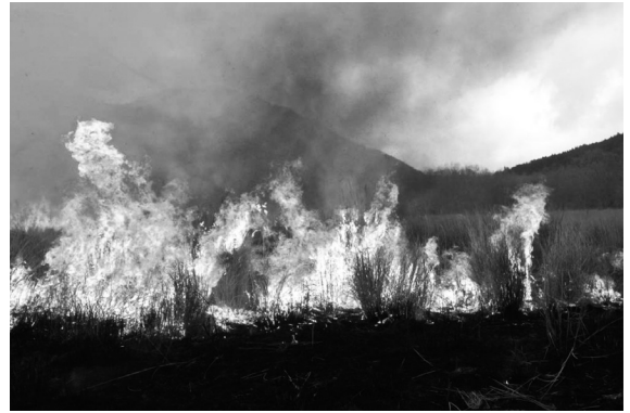
猪の瀬戸湿原の野焼き

野焼きの終わった草原に、芽吹きが始まり、キスミレ・エヒメアヤメ・サクラソウなどが咲きだします。またあちこちで植樹のイベントが行われて参加された方も多いと思います。春の雨を受け止めてしっかり苗が育ってくれると嬉しいですねえ。そのためには時々見に行って、下草を刈ったりツルを切ったりと手入れも必要です。