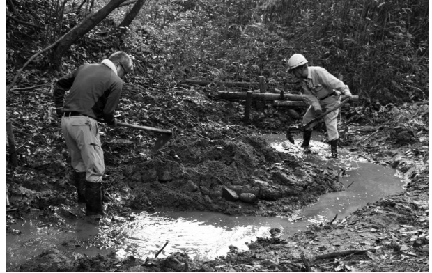
グリーンインストラクターおおいた 陣屋の村 自然保全活動（土砂で埋まった産卵地の整備）

秋が見当たらず、急に寒くなりました。 生物多様性の保全で問題の一つが、外来生物との対応です。駆除に成功した例（高島クリハラリス）や到底無理だと思われるものと様々です。新しい考え方「ニューワイルド」もこれから進んでいくと思います。 が、まずは在来種の保護ということで、オオイタサンショウウオ保護池の整備を由布市陣屋の村で行いました。