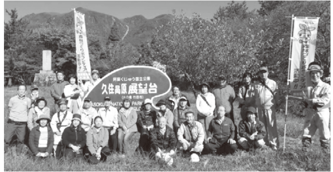
緑の工房ななぐらす 育った森の前で

澄み渡った青空のもと、久住町沢水展望台で、20年この森を整備してきた「NPO法人緑の工房ななぐらす」主催の行事「森の成人式」が開催されました。植樹され、手入れされ続けた森も、これからは自然の力で育っていくことになります。20年間も森を守り続けるのは本当に大変だったと思います。ありがとうございました。