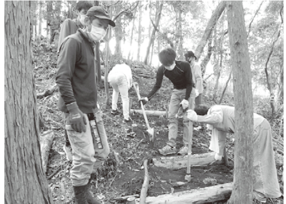
松ぼっくりの会 遊歩道に階段設置