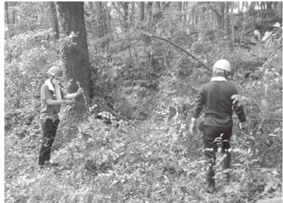
ソーシャルディスタンス(2m)ってこれくらい?! おおいた上野の森の会 8月22日

一向に収まる気配のないコロナウイルス感染と、少しは収まって欲しい猛暑。森林ボランティア活動は、無理せず焦らずお願いします。