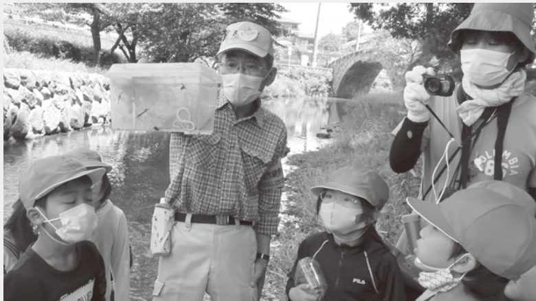
田尻小学校2年生 小さなへびさんを捕まえました