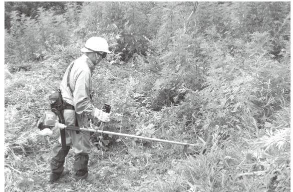
湯ノ見岳愛育会 夏草との戦い

熱中症とコロナウイルス対策を行いながらの作業で大変なことと思いますが、無理せず休憩しながら活動しましょう。