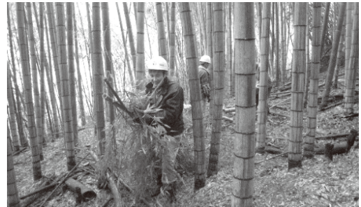
緑の工房ななぐらす 金明孟宗竹林整備

寒い季節です。でも風が吹かない晴天は身体も温まり、活動にはいい季節ですね。落葉した木々の枝は、可愛い新芽をつけて春の用意をしています。樹形を楽しんだり、たき火で温まったりと季節ごとの楽しみがあります。