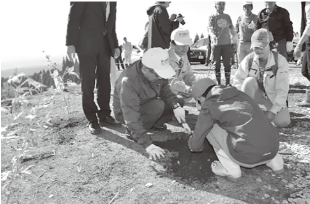
久住小学校からも100名の小学生が参加し植樹を行いました。

11月10日、爽やかに晴れ渡る秋空の下、彩り豊かに染まる山々に囲まれながら、「第18回豊かな国の森づくり大会」が竹田市で行われました。