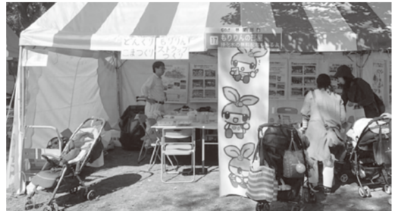
農林水産業祭 もりりんコーナー

お月様が冴え冴えと綺麗に見えるようになりました。 近々70歳までは希望すれば働き続けられるようになる そうです。10年前は60歳定年でその後に森林ボラ ンティアを始める方が大勢いらっしゃいましたが、70 歳を過ぎるといきなり森林ボランティア活動は難しい 状況です。若し(わけいし)熱烈歓迎!!