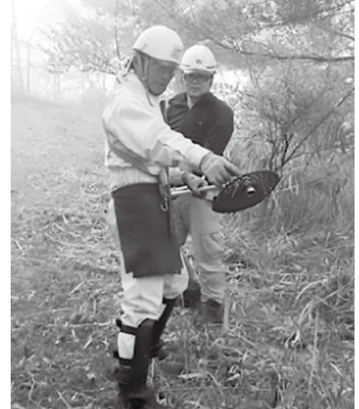
刈り払い機について指導 湯ノ見岳にて