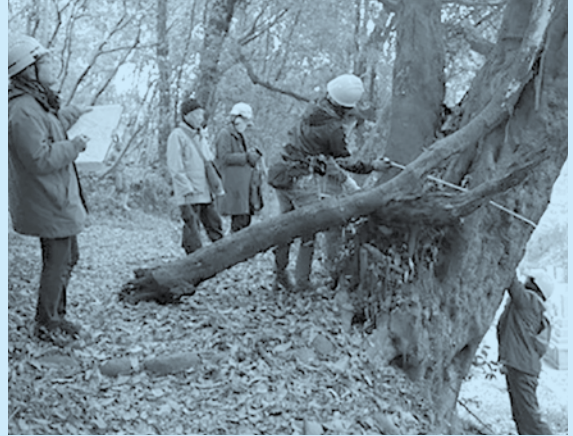
おおいた上野の森の会 (樹木調査)