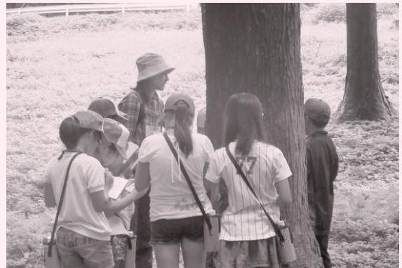
緑の少年団in県民の森 キャンプ